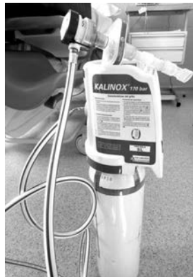
Figura 4. Mezcla N_2O / O_2 (mezcla equimolar)

La mezcla de gases ( N_2O/O_2 ) se suministra en botella, que ha de mantenerse sujeta y en posición vertical y a temperatura ambiente para su administración. Hay que tener en cuenta que las botellas llenas, antes de su utilización, han de permanecer un mínimo de 48 h a