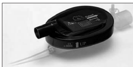
Figura 1. Sistema de aplicación de isoflurano y sevoflurano desechable

La administración de isoflurano o sevoflurano como anestésico en pacientes con ventilación mecánica, a través de tubo endotraqueal o traqueostomía, en el ámbito no quirúrgico puede realizarse mediante sistemas con recirculación de gases, que permiten que el aire del respirador entre mezclado con el gas anestésico. El dispositivo posibilita una reducción del consumo de anestésico al reutilizar los gases espirados del paciente, minimizando a su vez la cantidad de éstos que pueden pasar al ambiente y a los que, por lo tanto, pueden estar expuestos los trabajadores de estos ámbitos.