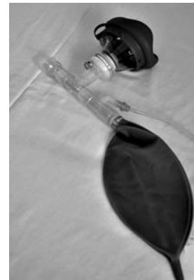
Figura 5. Aplicador mezcla N_2O / O_2 (mezcla equimolar)