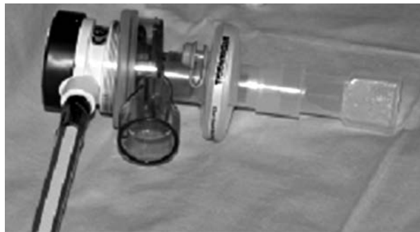
Figura 6. Aplicador mezcla N_2O / O_2 (mezcla equimolar) pediátrico

temperaturas entre 10 y 30°C. Debe evitarse exponer las botellas a temperaturas inferiores a los 0°C para evitar la licuación de parte del óxido nitroso.